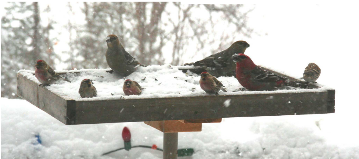
Les femelles sont marrons, le mâle est rouge, les petits sont des sizerins flammés.