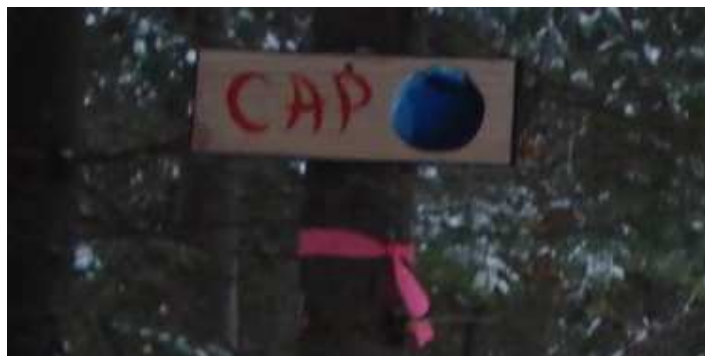
Les nouvelles affiches du Cap Bleu