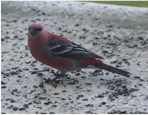
Un dur-bec sur mon balcon en Novembre 2008

Je n'avais jamais vu ces oiseaux auparavant. Lorsqu'ils sont arrivés, j'ai sorti mon guide d'identification et j'ai fini par les découvrir. J'avais vu la femelle en premier, d'où la difficulté pour l'identification, car chez les oiseaux le mâle a les couleurs les plus vives et c'est habituellement par lui qu'on identifie l'espèce. C'est seulement lorsque j'ai réalisé que cet oiseau marron était la femelle de l'oiseau rouge que j'ai pu les identifier. Ils ont exactement la même forme et la même grosseur, mais le mâle possède un plumage d'un beau rouge foncé. J'avais grand espoir de les revoir cette année, mais à date, aucun ne s'est pointé le bec.